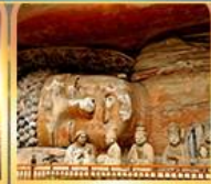
พาศินพระแกะสลักต้าจู๋