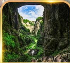
อุทยานหลุมฟ้า 3 สะพานสวรรค์