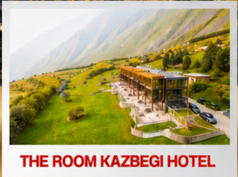
THE ROOM KAZBEGI HOTEL