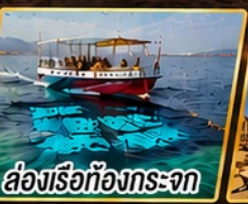
ล่องเรือท่องกระเจก