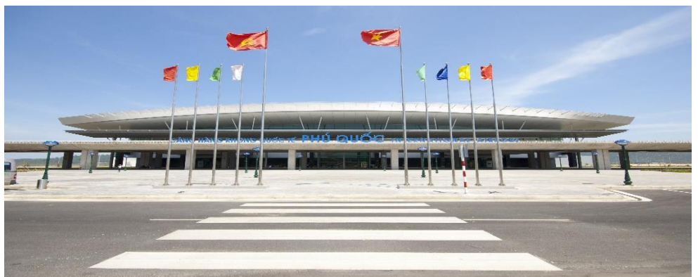
PHU QUOC (สนามบินพูก๊วกประเทศเวียดนาม)