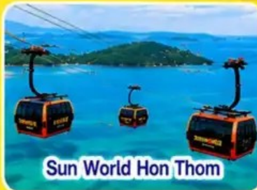
Sun World Hon Thom