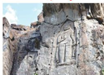
พระพุทธรูปคาร์กาห์

** พักที่ Kallisto Hotel หรือเทียบเท่า **