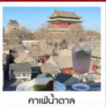
คาเฟ่เป็ดปักกิ่ง