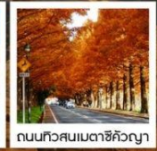
ถนนทิวสนเมตาชิคังญา