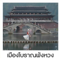
เมืองโบราณฟังหวง