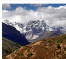
ภูเขาหิมะเหมยลี่

สวนน้ำตก / อุทยานผู้ต่าซิว (รถแบริดเตอร์) / เมืองโบราณแชงกรีล่า วัดลามะชงจ้านหลิง / โค้งแรกแม่น้ำจินซาเจียง / ภูเขาหิมะไป๋หม่าง วัดเฟยโหล / ชมภูเขาหิมะเหมยลี่ / วัดตงจู่หลิน อุทยานยาดิง (รวมรถอุทยาน + รถแบริดเตอร์) / กู่หงุาลี้หวง ทะเลสาบน้ำนม / ทะเลสาบห้าสี / วัดชงกู่ / ทะเลสาบไข่มุก ถนนคนเดินจินปี้ลู่ / ตำนั๊กทอง