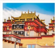
วัดชงจ้านหลิง

คุนหมิง • ยาดิง • เต๋อซิง • แชงกรีล่า 8 DAYS 7 NIGHTS