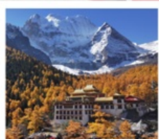
วัดชงกู่