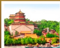
อวี่เหอหยวน