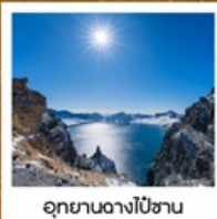
อุทยานอางโป๋ซาน