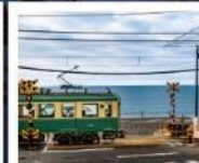
รถไฟเอโนะเด็ง