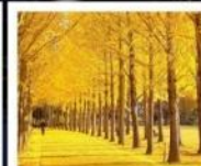
สวนเอ็กซ์โป