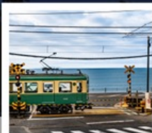
รถไฟเอโนะเดิน