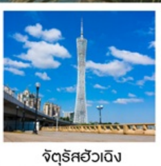
จัดุริสฮิวอิง