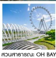
สวนสาธารณะ: OH BAY