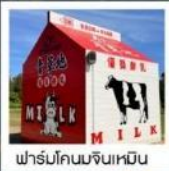
ฟาร์มโคนมจินเหมิน