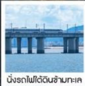
นั่งรถไฟใต้ดินข้ามทะเล