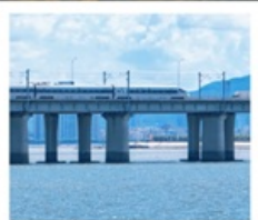
นั่งรถไฟใต้ดินข้ามทะเล