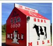
ฟาร์มโคนมจินเหมิน