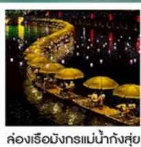
ล่องเรือมังกรแม่น้ำก้งซุย