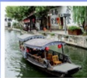
เมืองโบราณหนานสวิน