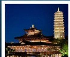
เมืองโบราณผู้หยวน

เมืองโบราณผู้หยวน / ภูเขาหินัวส่วชาน (รวมรถกอล์ฟ) ห้างสรรพสินค้าเต๋อจี / วัดจีหมิง / ทะเลสาบเซวียนอู่ ถนนอู่กงต้าเต้า / อู๋ซีหมู่บ้านเหนียนฮาวาน / เขาหูซิว เชียงใหม่ คลาสสิก ไท่ / ถนนนานกิง / Tian An 1,000 Trees North Bund Green Land / Florentia Village Outlet