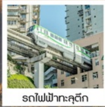
รถไฟฟ้าคุตัก