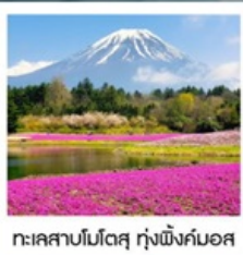
ทะเลสาบโมโตสุ ทุ่งพืชมอส