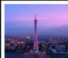
แคนตันทาวเวอร์