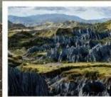
สวนหินปาเหมย์