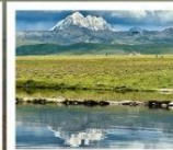
ดวงตาแห่งถ้ำกวาง