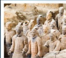
พิพิธภัณฑ์กองทัพใต้ดิน

พิพิธภัณฑ์กองทัพใต้ดินทหารม้าจีนซี (รวมรถแบตเตอรี่)