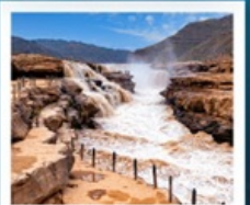
น้ำตกหูชิว