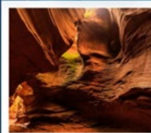
แกรนด์แคนยอนยูดาโกว