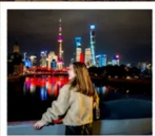
เซี่ยงไฮ้คลาสสิกไนท์