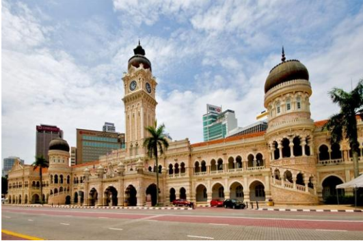
จากประเทศในเครื่องจักรภาพ

วันที่สอง มัสยิดอาเหม็ด – พระราชวังอิสตันนา – เมอร์เดก้าสแควร์ – ตึกปิโตรนัส – เก็นติ้งไฮแลนด์ – CABLE CAR - อิสระตามอัธยาศัยบน GENTING (B/-/-)