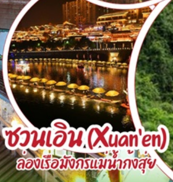
ชว่นเอน (Xuan'en) ล่องเรือมังกรแม่น้ำก่งซู่