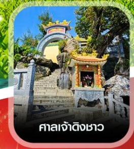
ศาลเจ้าดิงเซา