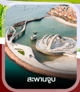
สะพานจูบ

✈️ คอนเฟิร์ม ออกเดินทาง ทุกพีเรียด 2 ท่านขึ้นไป