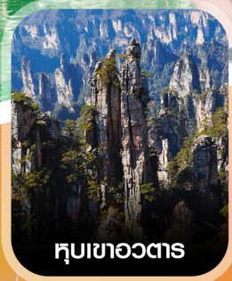
หุบเขาอวตาร

คอนเฟิร์ม ออกเดินทาง ทุกพีเรียด 2 ท่านขึ้นไป