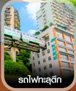
รถไฟฟ้าฉิ่ง