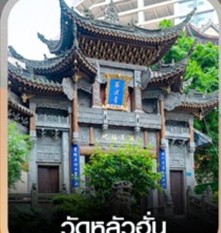
วัดหลิวอัน