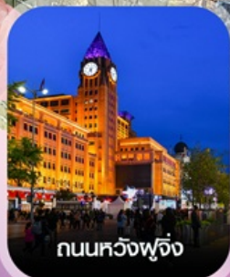
ถนนหลวงฟู้จิ่ง

✈️ คอนเฟิร์มออกเดินทาง ทุกพีเรียด 2 ท่านขึ้นไป