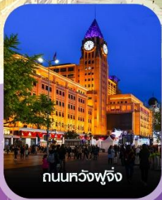
ถนนหลวงฟู้จิ่ง