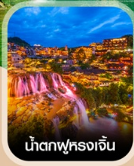
น้ำตกฟูหลงเจิน

สัมผัสสายหมอกแห่งขุนเขา สะพานอ้ายจ้าย แบบพาโรนามา แช่น้ำพุร้อนกลางธรรมชาติ อุทยานป่าไม้บูเออร์เหมิน ชมความอลังการ น้ำตกพันปี หมู่บ้านโบราณผู่หลงเจิน