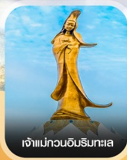
เจ้าแม่กวนอิมริมาทะเล

✈️ คอนเฟิร์มออกเดินทาง ✈️ ทุกปีเรียด 2 ท่านขึ้นไป