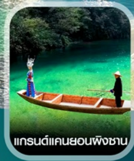
แกรนด์แคนยอนผิงชาน

คอนเฟิร์มออกเดินทาง ทุกพีเรียด 2 ท่านขึ้นไป