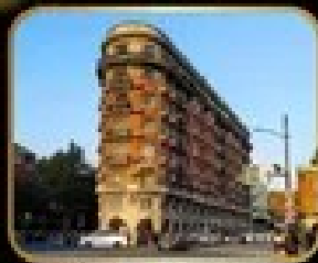
ถ่ายรูปจุดเริ่มต้น WUKANG MANSION