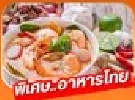
พิเศษ! อาหารไทย