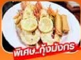
พิเศษ! กุ้งมังกร