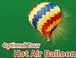
Optional/Free Hot Air Balloon