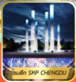
ตึก SKP CHENGDU