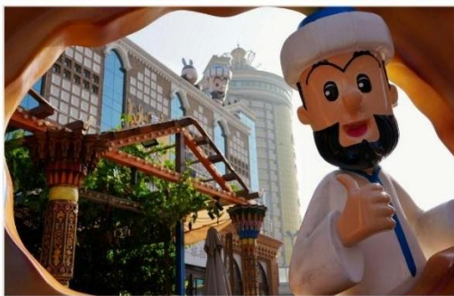
ตลาดนานาชาติซินเจียงแกรนด์บาร์ซาร์