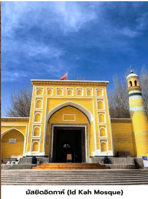
มัสยิดอิคกาห์ (Id Kah Mosque)