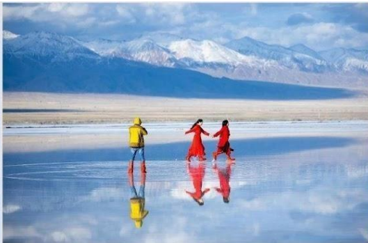
"ทะเลสาบเกลือชาการ์" (Chaka Salt Lake)