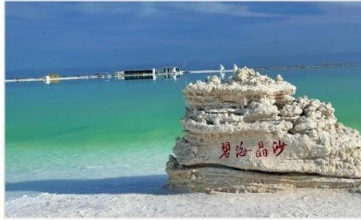
ทะเลสาบเกลือจาเอ๋อฮั่น (Chaerhan Salt Lake)