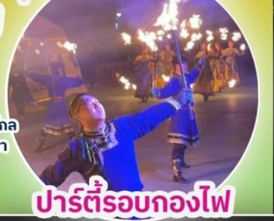
บาร์ตี้รอบกองไฟ

เช็คอินโฮโลก์เด็ด น้ำหนักกระเป๋า 20 KG พักโรงแรม 4 ดาว