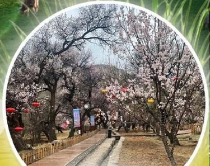
หุบเขาดอกแอปเปิ้ล

ทุ่งหญ้าซิลามูเหริน - พิธีการขอพรจากไอวเฮา - บาร์ตี้กองไฟ - หมู่บ้านชนเผ่ามองโกล สวนวัฒนธรรมมองโกลเหมิงเสียง - หุบเขาดอกแอปเปิ้ล - ทะเลทรายอินเคินทาลา แหล่งวัฒนธรรมมองโกลหยวนหลิว (รวมรถกอล์ฟ 2 ขา) - ตลาดกลางคืนเจียไท่ สวนวัฒนธรรมการแต่งงานสุดเอ็กซ์คลูซีฟแห่งเดียวในประเทศจีน บ้านองค์ปฐม - เซตการท่องเที่ยวเจงกิสข่าน-ถนนคนเดินคังปาซือ