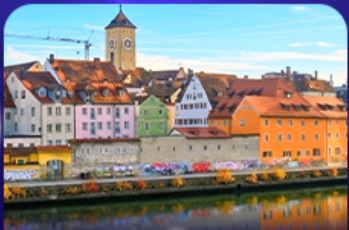
ย่านเมืองเก่า เรนเนสซองส์