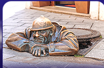
รูปปั้นคูมิล บราติสลาวา