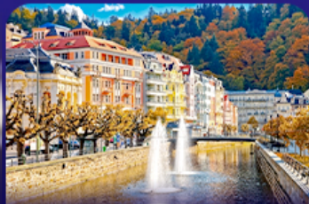
เมืองแห่งสปา คาร์โลว วารี