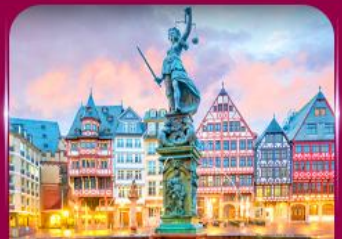
จัตุรัสโรเมอร์ ปรากท์เพิร์ต