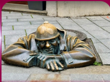
เชลฟี่คูคูมิล บราติสลาวา