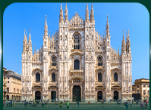
เซ็คชิน มหาวิหารดูโอโม มิลาน