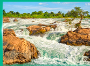
น้ำตกหลี่ผี