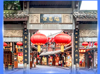
หมู่บ้านโบราณฉือซื่อ