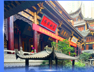
วอพรวัดหลิวฉิน ฉงชิ่ง