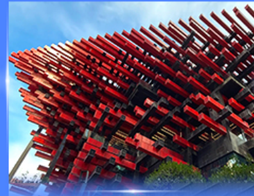
แลนด์มาร์คตึก ตึกตะเกียบ