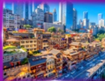
เข็คฉินย่านต้ง หงหยาดัง