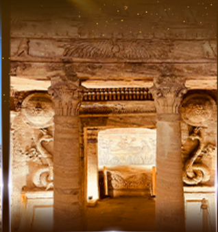
สุสานใต้ดินอเล็กซานเดรีย