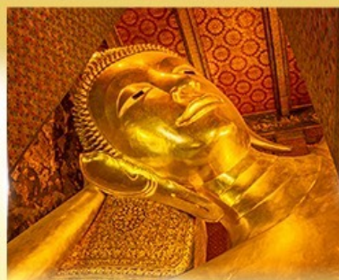
วัดพระเชตุพนวิมลมังคลาราม (วัดโพธิ์)