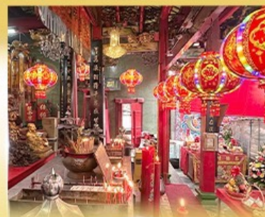
ศาลเจ้ากวนอู คลองสาน