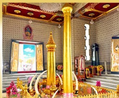
ศาลหลักเมือง กรุงเทพมหานคร