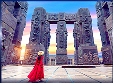
อุทยานประวัติศาสตร์จอร์เจีย