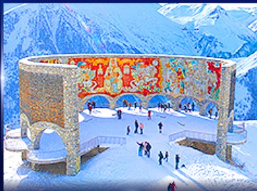
อนุสาวรีย์มิตรภาพ รัสเซีย-จอร์เจีย