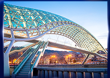
สะพานแห่งสันติภาพ ทบิลีซี